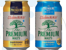
経済産業大臣賞 《ザ・プレミアム・モルツ、 ザ・プレミアム・モルツ <香る>エール CO2削減缶 サントリー