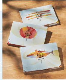
経済産業大臣賞 《「Dashi - Cha®」 味の素株式会社

市場で販売されている商品化されたコマーシャルパッケージの優秀性を競う商品包装コンペティションです。経済産業大臣賞を筆頭に34作品が選ばれました。