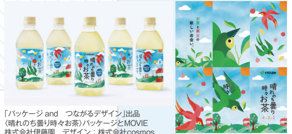
「パッケージ and つながるデザイン」出品 《晴れのち曇り時々お茶》パッケージとMOVIE 株式会社伊藤園 デザイン:株式会社cosmos

この企画では、「PACKAGE DESIGN INDEX 2024 パッケージ and」に掲載されたパッケージのなかから、「パッケージ and つながるデザイン」をテーマに8点の作品を選び、その魅力を紹介します。