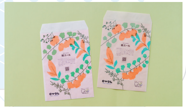
経済産業大臣賞 《紙エール デザインウインドウ》 日本紙ハルプ商事株式会社 株式会社イムラ